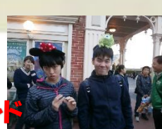
東京ディズニーランド

3日間、東京方面に修学旅行に行ってきました。日頃の生活ではなかなかできない体験をしました。友達との素敵な思い出をたくさん作ることができました。