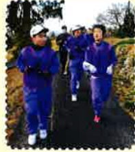
体育 天津マラソン

今年は全員で天津神社へ。走ったり歩いたりして神社を目指しました。「寒さなんか吹き飛ばすぞ」