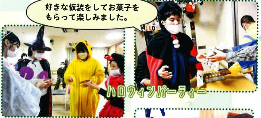
ハロウィンパーティー