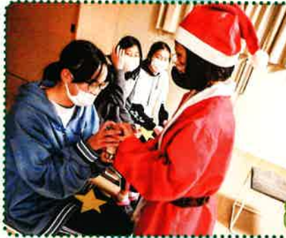
おやつパーティー