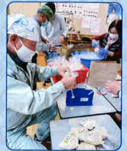
実行委員の皆さん