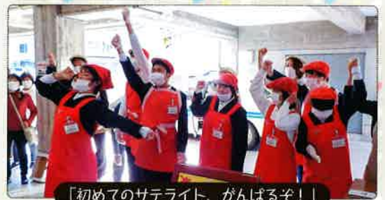
「初めてのサテライト、がんばるぞ！」

A 中学部2・3年生が、美咲町役場前のバス待合所で「サテライト美咲」を開店しました。4日間限定で、コーヒーの提供や作業学習で作った製品の販売を行い、地域の方々や保護者の皆様など多くのお客様にご来店いただきました。生徒たちは「笑顔で」や「大きな声で」、「よい姿勢で」などそれぞれに目標を持って取り組み、緊張しながらも、学校での学習の成果を発揮し、意欲的に活動することができました。