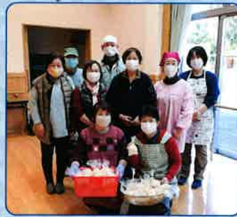
地域の方が作ってくださったポン菓子