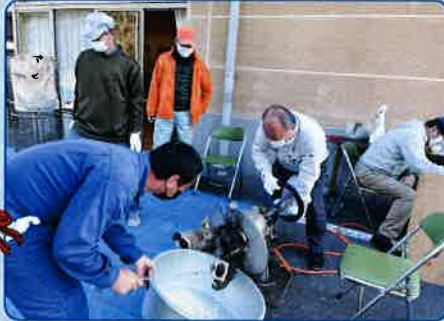
誕生寺公民館で作っている様子