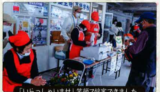
「いらっしゃいませ」笑顔で接客できました。