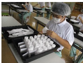
フルーツキャップ折り