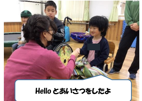
Hello とあいさつをしたよ