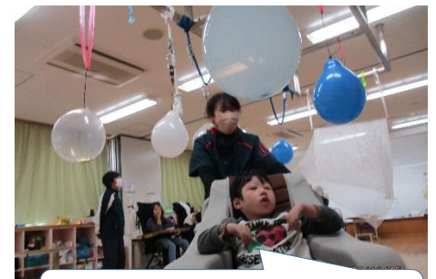
雪の中をぞりに乗って進んでいるよ

【中学部】 ALT の先生扮するサンタさんと一緒にみんなでクリスマス会をしました！