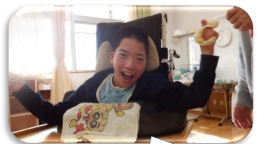
手で握って、生地をこねているよ