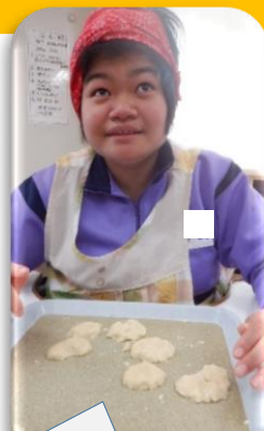
どう？上手にできた？