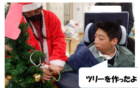
ツリーを作ったよ