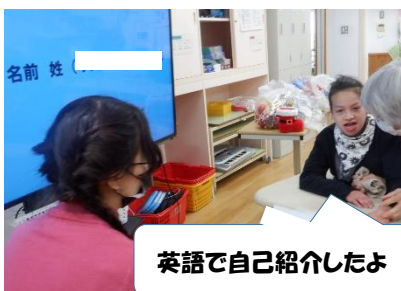
英語で自己紹介したよ

【中学部】 ALT の先生扮するサンタさんと一緒にみんなでクリスマス会をしました！