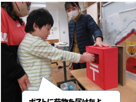
ポストに荷物を届けたよ