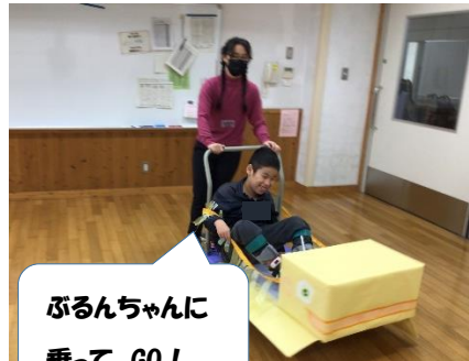
ぶるんちゃんに 乗って、GO!