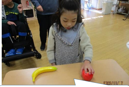
りすさんの落としたいんごを探しているよ